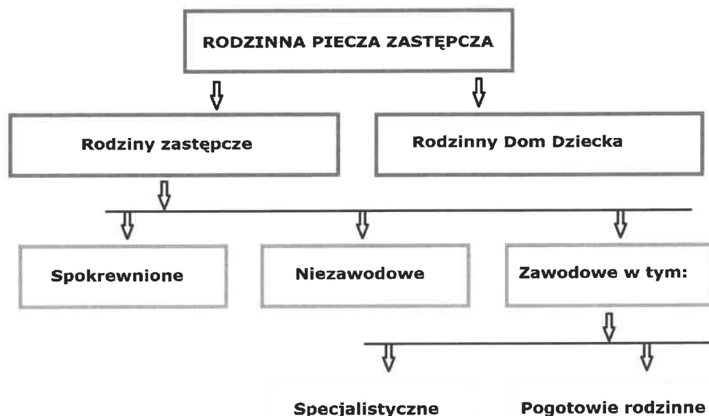
Rys 1. Podział rodzinnej pieczy zastępczej.

W przypadku gdy w rodzinie zastępczej zawodowej lub rodzinie zastępczej niezawodowej przebywa więcej niż 3 dzieci lub w szczególnie uzasadnionych przypadkach, na wniosek rodziny zastępczej, można zatrudnić osobę do pomocy przy sprawowaniu opieki nad dziećmi i przy pracach gospodarskich. Osobą zatrudnioną do pomocy przy sprawowaniu opieki nad dziećmi i przy pracach gospodarskich może być także małżonek niepobierający wynagrodzenia z tytułu umowy o pełnienie funkcji rodziny zastępczej zawodowej.